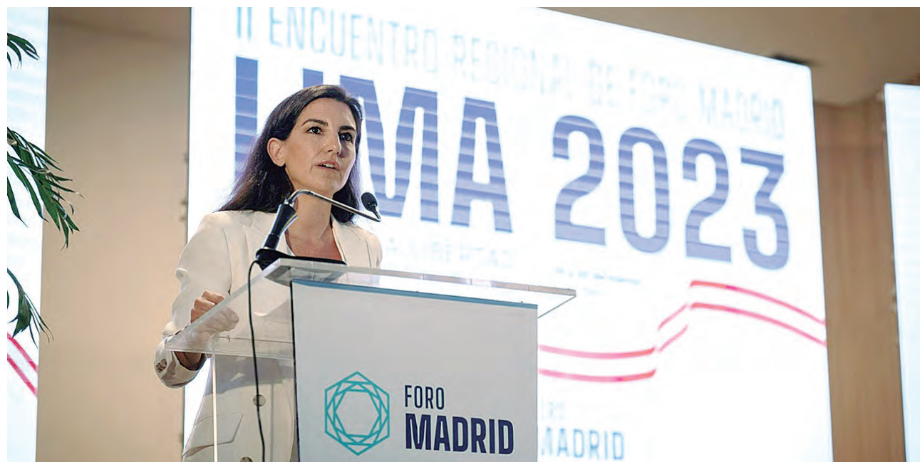
Rocío Monasterio vocera de Vox, es uno de los personajes que lideran la lucha contra el 'comunismo internacional'.