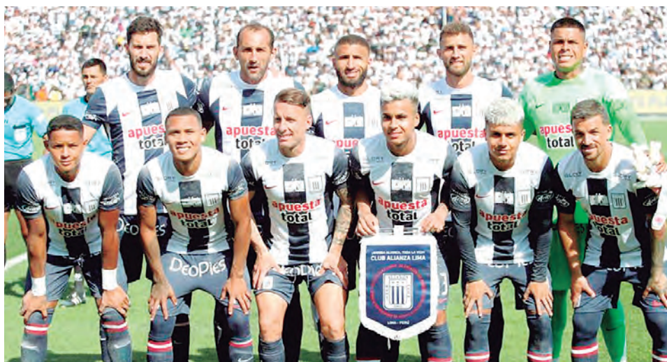
Alianza Lima el de mayor inversión económica para la Libertadores.

BRASILEÑOS SON los más que más invirtieron con enorme diferencia de tres de ellos sobre los demás. Alianza Lima se ubica en el puesto 20, por encima de Cristal y Melgar.