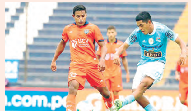
LIGA 1: CRISTAL RECIBE A CÉSAR VALLEJO

En ese sentido, Javier Tebas, presidente de La Liga, no anduvo con vueltas y, hace dos semanas, hizo público su deseo: "Como soy fan de Leo Messi y creo que es el mejor jugador del mundo, ojalá pueda volver al Barcelona. Lo deseo, porque me gustaría que jugase en nuestra competición". ¿Será?