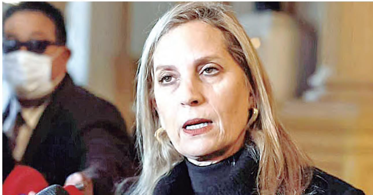
María del Carmen Alva desde la Comisión de Relaciones Exteriores, guía la política internacional del Gobierno.

No obstante, como las relaciones diplomáticas no tienen el liderazgo de Torre Tagle sino del Congreso de la República y como para hacer creíble la denuncia de Dina Boluarte de las balas Dum Dum, el 26 de enero pasado