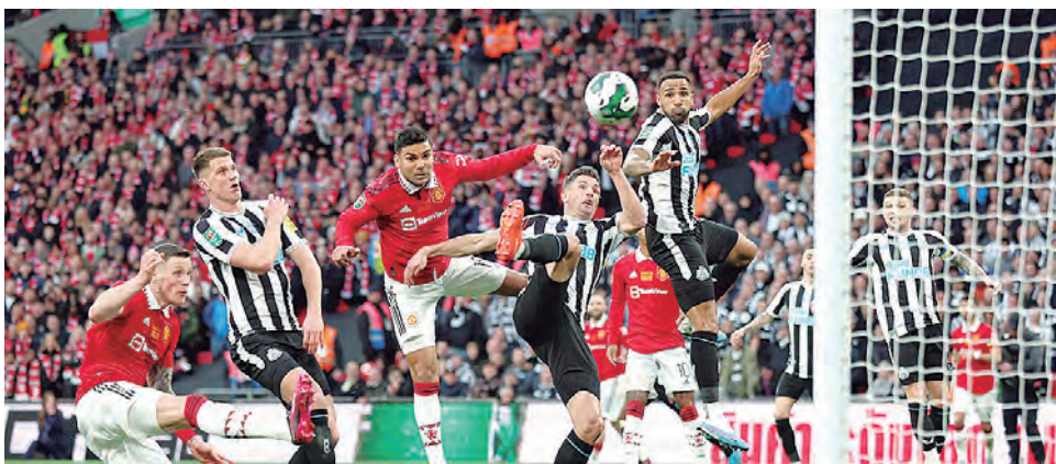
Casemiro anota el primer gol en la final de la Copa de la Liga.

DERROTARON AL NEWCASTLE 2-0 con goles de Casemiro y Rashford, sumando su sexto título en general. Partido se jugó en el mítico estadio de Wembley.