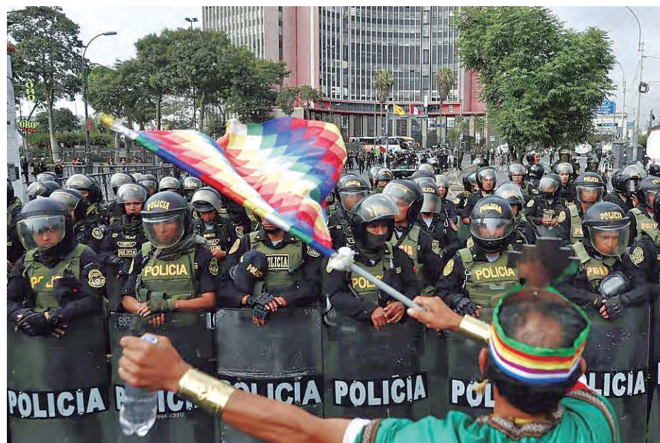
Dos meses de protestas reflejan el rechazo a la élite que recapturó el poder.

Para Gustavo Gorriti, director de IDL-Reporteros, tenemos un Ejecutivo muy mediocre, compuesto por un primer ministro que ha cambiado de nociones y principios. “Hay un Ejecutivo muy mediocre que, además,