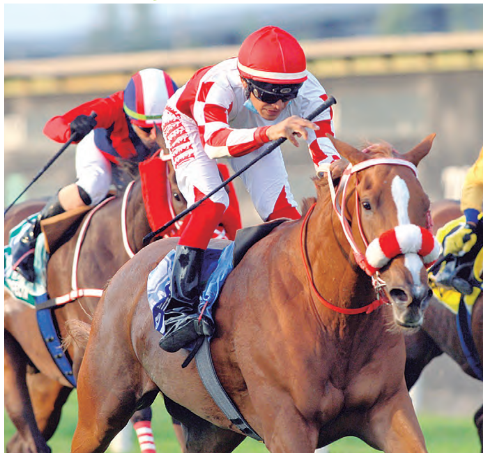
La del Wall Street por su sexto éxito en solo siete presentaciones

quez ganó bien en la condicional y sus conexiones piensan que ya está listo para luchar en un mejor escenario. Mientras que Modric, que mejor aval que sus cuatro victorias consecutivas, mantiene la monta de Carlos Trujillo.