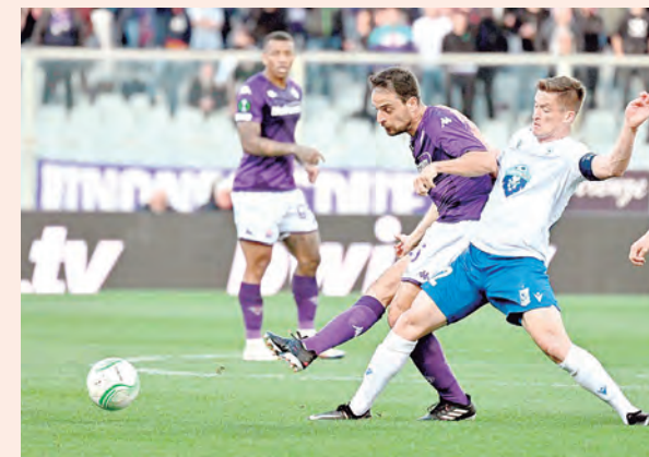
FIorentina-BASILEA Y WEST HAM-AZ ALKMAAR

dad también de aceptar la invitación de Rotax Chile para medir fuerzas en el torneo local y enseguida el Campeonato Sudamericano que organiza nuestro país del 27 de junio al 1 de julio, además de tercera y cuarta fecha del certamen patrio.