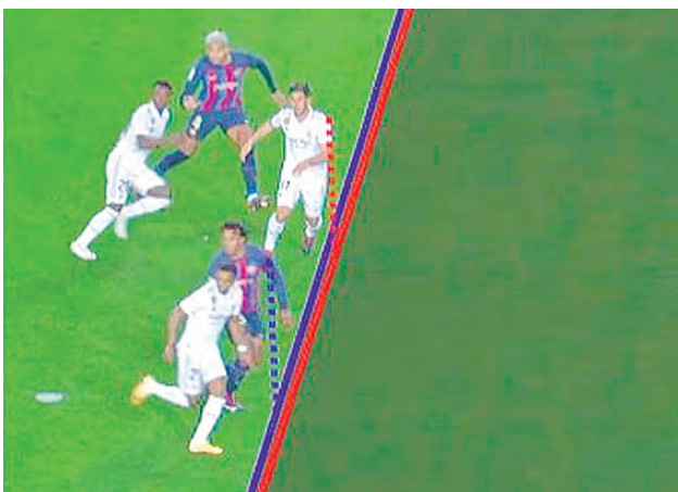
El hombro de Asencio estaba adelantado y el VAR lo anuló.

Xavi siguió con su 4-3-3, con Lewandowski como punta y a los extremos, Raphinha y Gavi. En la