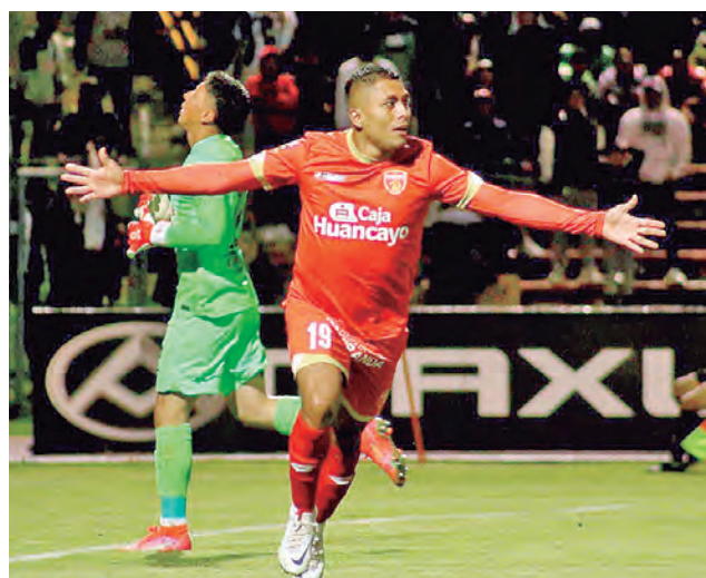
En la altura, Huancayo sacó un importante triunfo.