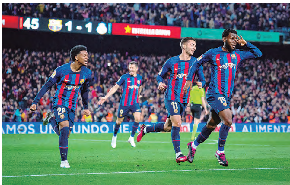
El gol de Kessie cuando se jugaba el tiempo de compensación.

VENCIO 2-1 A REAL MADRID y le sacó 12 puntos de ventaja. El VAR anuló un gol de Asencio por el hombro izquierdo adelantado cuando el cotejo iba 1-1.