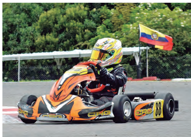
Gran estampa de Kishimoto.

Lamentablemente en la final un rezagado lo impactó incluso subiéndose a su auto relegándolo a últimas posiciones, sin embargo, logra remar y termina en la séptima colocación con