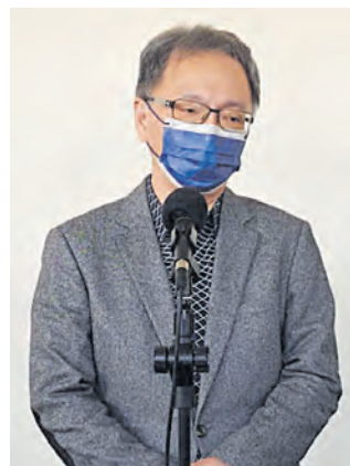
El ministro de Salud Hsueh Jui-yuan

El Centro de Operaciones para el Control de Epidemias (CECC, siglas en inglés) de Taiwán ha anunciado que los costos de los tratamientos médicos relacionados con la COVID-19, como los medicamentos antivirales, seguirán siendo cubiertos por el Estado a corto plazo. El ministro de Salud, Hsueh Jui-yuan, ha declarado que, en el futuro, el COVID-19 se gestionará de manera similar a la gripe, y