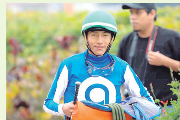
Bagni Ylachoque con Spindrift, gran chance en la penúltima de la tarde.

RIVALES : PITIGLIANO(1) - BENJAMIN(11) - DON ENRIQUITO(12).