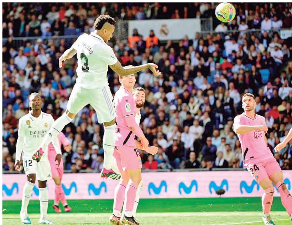
Militao anota uno de los goles merengues en el triunfo de ayer.