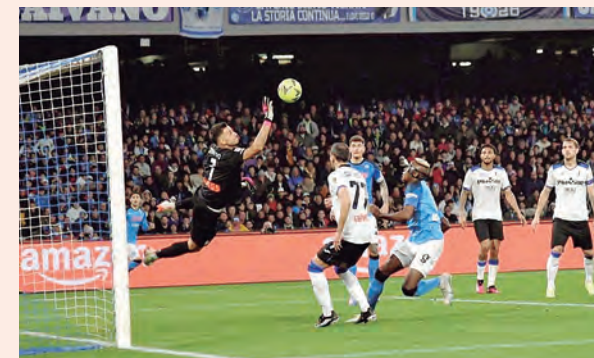
CALCIO: GANÓ 2-0 AL ATALANTA

La fecha se completó ayer con estos resultados: Elche 1 Valladolid 1; Celta 3 Rayo Vallecano 0; Valencia 1 Osasuna 0.