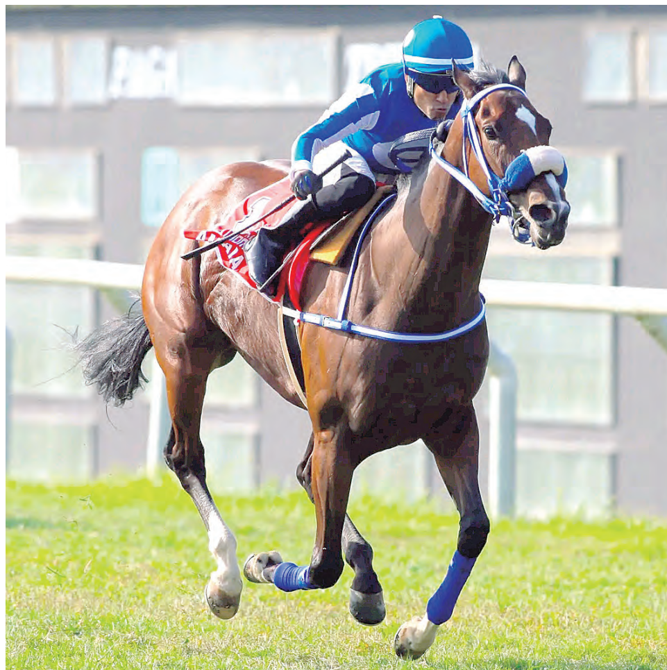
La del Aurora es efectiva en la receta

al césped, ganó 'caminando' en los 2 mil metros, disputando una condicional, así que aparece con opción clara de dar el golpe.