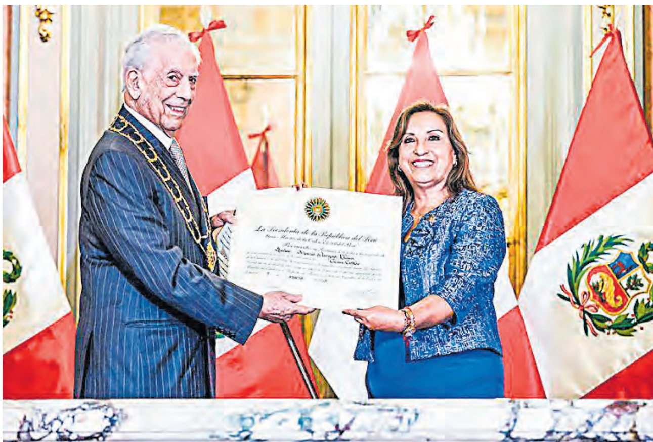
Mario Vargas Llosa y Dina Boluarte, un sicosocial innecesario de un gobierno cívico-militar fascista.