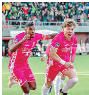
sumó 21 puntos (15 puesto) y Excelsior se quedó en 20.

salió de zona de promoción, dejando en dicho lugar a su derrotado de ayer. Los goles del equipo rojo y blanco, los anotó por partida doble ter Haar Romeny a los 63' y 71' del complemento. Emmen