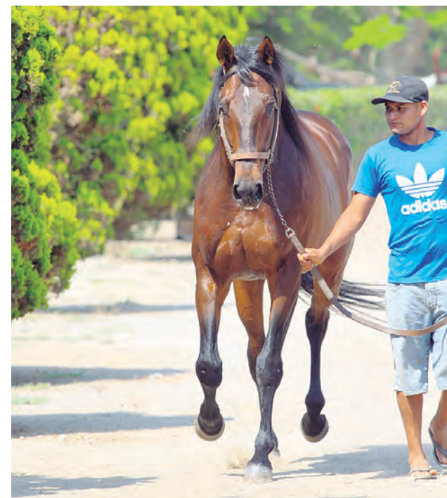
Draft Pick, de fina estampa.

Mientras tanto, se espera el arribo de estos productos a Monterrico para que se repitan tardes de gloria, como las experimentadas con Maggie Lee, yegua insignia del criadero, múltiple ganadora clásica y récord horse, que también regresó a su punto de origen, ahora como yegua madre. De manera que son llamados a convertirse en los campeones del mañana.