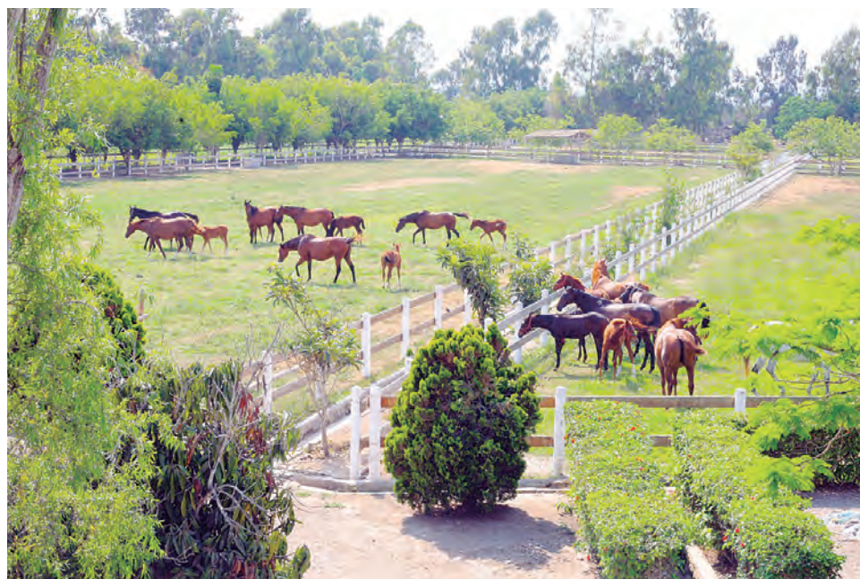
El criadero funciona al sur de la ciudad en doce hectáreas de extensión

después se mantiene en la hípica con el mismo empuje. Tanto como para haber traído otros padrillos como Spin Master, Class Leader y, recientemente, Draft Pick.