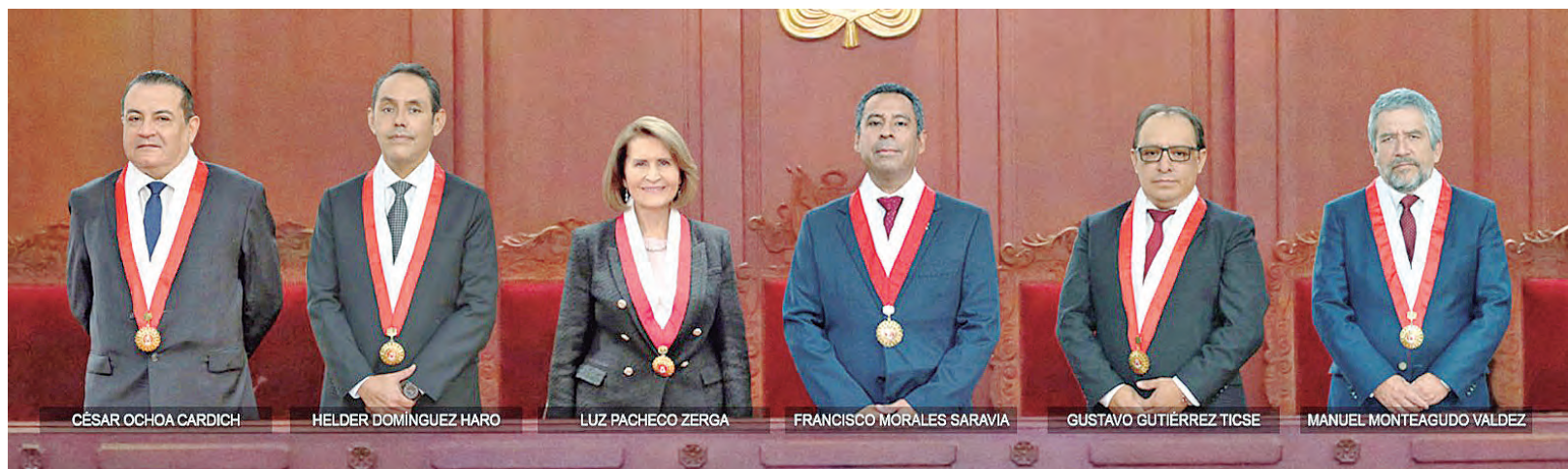
Los miembros del TC le devolvieron el favor al Congreso que los eligió.

“La sentencia del TC afecta a la democracia, rompe el equilibrio de poderes y le entrega todo el poder al Legislativo, lo cual ratifica la alianza de Dina