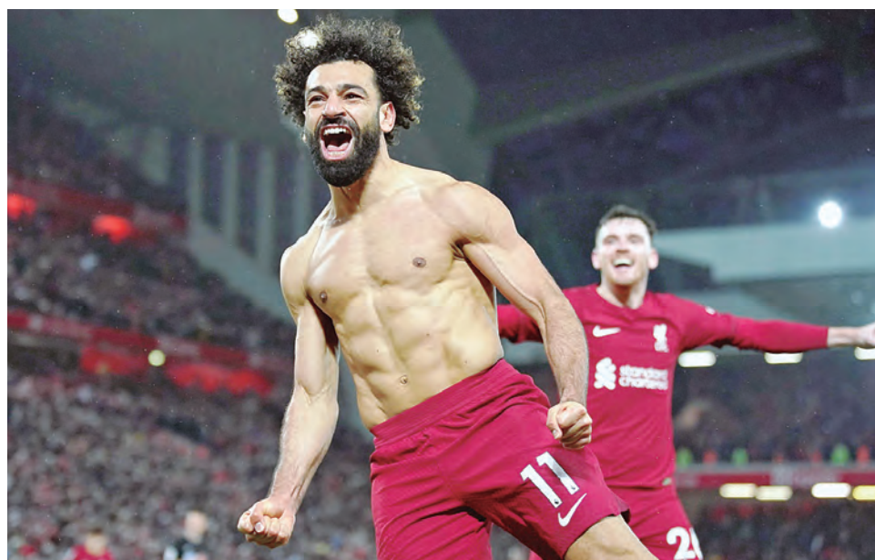
Salah celebra uno de sus dos goles en la goleada histórica sobre el United.

LOS "DIABLOS ROJOS" golearon a los de Old Trafford 7-0 en Anfield, y ahora están en zona de clasificación a la Europa League.