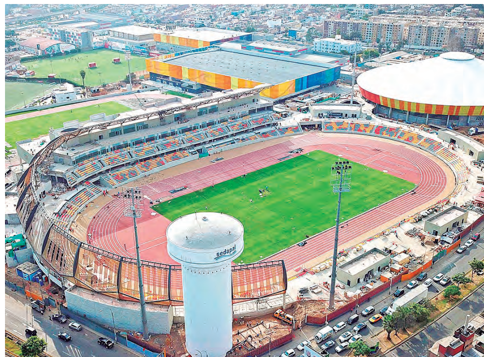
Lo que era un rumor, terminó por confirmarse con el comunicado de la Fifa.

Luego, agrega: «a pesar de la buena colaboración entre la Fifa y la FPF, se ha decidido que no se dispone de suficiente tiempo para asegurar la inversión y concluir el trabajo con el gobierno peruano antes del