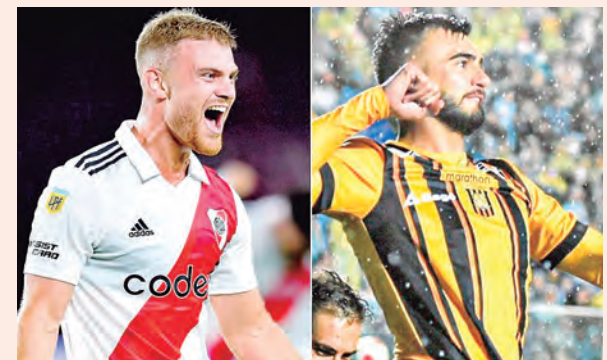
LIBERTADORES Y SUDAMERICANA 2023

los desastres naturales, los diferentes escenarios de nuestro país hasta el día de hoy tampoco habían tenido alguna mejora y eso, de alguna manera, también fue responsabilidad de la FPF.